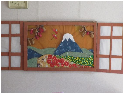
窓を開ければ秋の富士 デイの皆さん方の力作です。