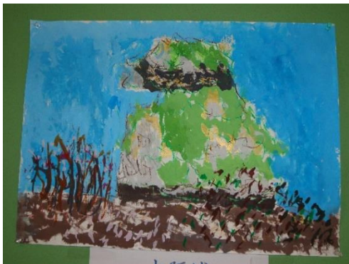
20年前に上がった大阪城の天守閣 とても綺麗だったことを思い出して・・・ また行ってみたいです。