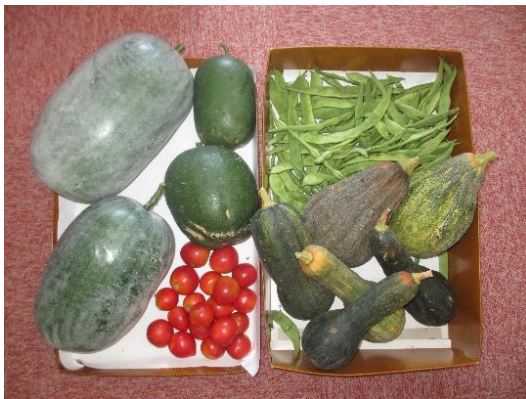
無農薬野菜のオンパレード 〇様ご夫妻の野菜が届きましたよ～