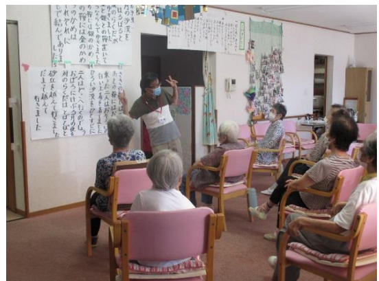
9月の歌は「月の砂漠」 コロナに負けずに歌いましょう マスクそのまま、もう少し広がって！