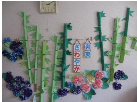
さわやか竹林 あじさいも咲きみだれて、きれいです。