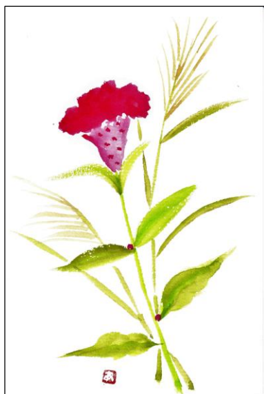
則久 昭代 画

全ての人々には自由に移動する権利があり、移動は単なる手段ではなく、地域の社会参加や生きがいづくりにつながっている大切なものである。目の前に立ちはだかっている公共交通の課題に対し、行政、交通事業者、NPO団体、地域住民が一体となって協働して、取り組んでいかなければならない。また、市の福祉分野と交通分野の連携も不可欠である。当団体としても、川西市唯一の福祉有償運送団体として、今後も事業を維持発展させると共に、健康でにぎわいのある街づくりのために、今までの経験を活かし、さらに市内の地域公共交通にも寄与していく所存である。