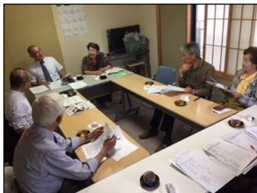
令和元年5月理事会風景

2019年5月27日(月)さわやか事務所にて、令和元年度第1回理事会・総会を開催した。平成30年度は、3年に1度の介護報酬改定の年となり、報酬面では、全体では0.54%のアップであったが、さわやか北摂が運営している訪問介護や通所介護においてはほぼ据え置きとなり、自助努力が必要不可欠な年となった。年度の途中で、不採算部門の居宅介護支援事業を閉鎖するも、収入面で大きな変化はなかった。各スタッフのきめ細やかな心配り、そして惜しめない努力があったからこそ、である。24年が経過したさわやか北摂の