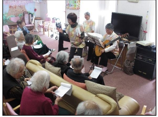
みんなで歌いましょう ♪ババロアトリオ♪

いつ聴いてもお正月気分になっていいねえ、と好評です。今まで尺八とのコラボが多かったのですが、今回は黒1点の尺八の音色がひびき渡りました。今後ともよろしく。