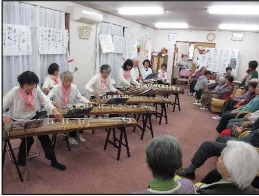
お琴と尺八 羽奈の会

いつ聴いてもお正月気分になっていいねえ、と好評です。今まで尺八とのコラボが多かったのですが、今回は黒1点の尺八の音色がひびき渡りました。今後ともよろしく。