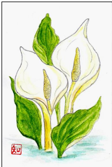
福武 知子 画

公益財団法人ひょうごコミュニティ財団主催の「共感寄付」第2期が始まって約2か月半が過ぎま