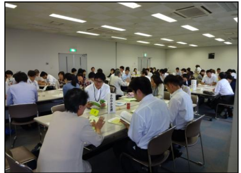
活発に論議される交流会風景

毎年参加させていただいているが、年々交流が深まってきたように感じる。NPO 活動を先ず知っていたが、官民一体となって住みよい川西市を目指していきたいと、参加者全員の思いは共有出来たと思う。