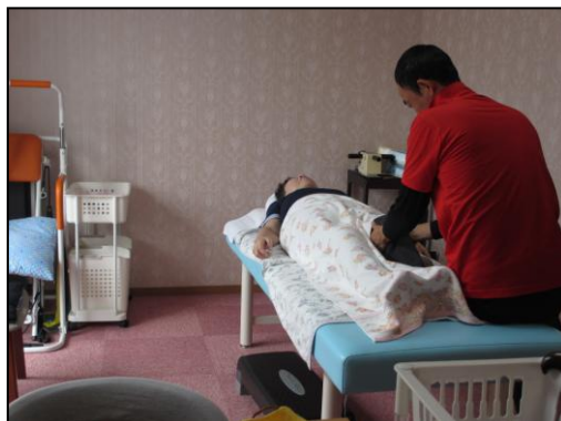
リハビリ・マッサージ 柔道整復師によるマッサージを受ける 利用者の方々、楽になったわあ