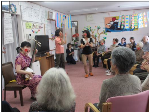
津軽三味線とギターのコンサート 何度聞いても素晴らしい演奏に拍手喝采。 おなじみの‘おてもやん’ではみんなで 歌って踊りました。マタ来テネ!