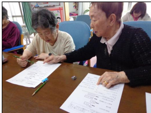
らくしゅう式で脳のリハビリ中 認知症予防の最新プログラムで学習療法の 他にも運動型機能訓練やレクなどで 前頭葉トレーニングにとりこんでいます。