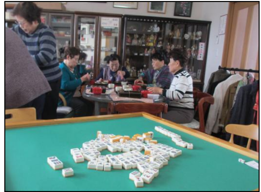
居場所で健康マージャン 脳トレーニングを兼ねて月2回集まっ ています。6~7人位で。先生格から新人生 まで和気あいあいです。いらないマージ ャン台をお譲り下さい。