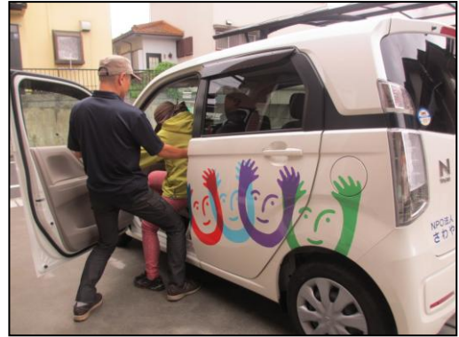
Nワゴンで移動介助 日本財団から3月24日に寄贈を受けたホン ダNワゴン4人乗りは、毎日大活躍していま す。初代の軽ホンダのように、20年走りた いと大切にに使わせていただきます。