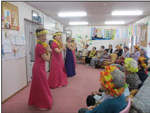
初夏のフラダンス ラブリーフラ ラウレアの皆さんは ウクレレをひいてデイの皆さんと歌った り、もちろん優雅なダンスはバッチリ。 季節ごとのフラダンスもあるそうですよ。