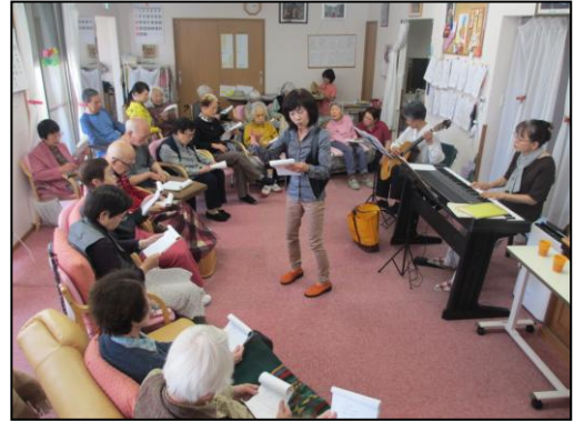
ババロアトリオ みんなで歌おう トリオです! ピアノ、ギターに合わせてボーカルさんの 盛りあげで、いつの間にか大合唱。笑顔 がいっぱいです。