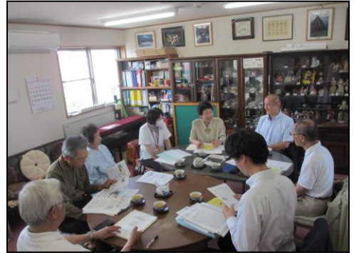
27年度理事会（水明台にて）

5月29日（金）午後3時より理事会と総会を開催した。平成26年度も、「困った時はお互い様」の精神で、さわやか北摂の本来事業である「たすけあい事業」や「地域の居場所」を充実させ、高齢者や障がいをお持ちの方をサポートし地域に貢献している。収支としては、さわやかデイサービス緑台がやや減収となったが、訪問介護・障がい福祉サービス・さわやかデイサービス水明台の各部門は増収となり、全体としては前年度比7.5%の増収となった。