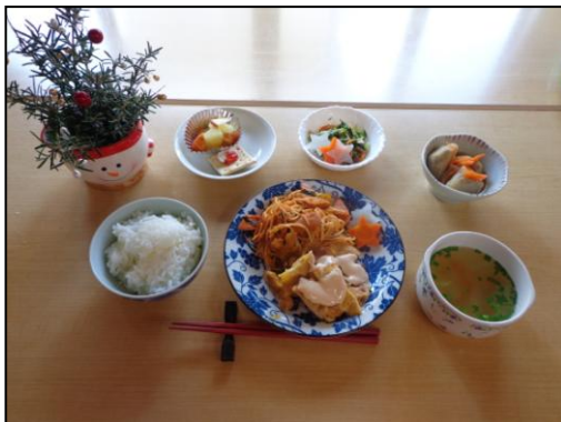
さわやかデイ・ランチ チキンフライタルソース・スパゲッティ ナポリタン・長いもおかか煮・野菜ミックス 酢の物・野菜たっぷりスープ・フルーツ カ ナッペクリームチーズかけ